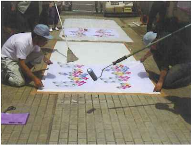
④ポリエステルシートを配置 クロスを決めた位置に配置