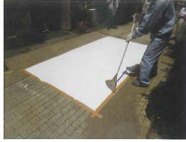
②ベースコート塗布 マスキングテープを貼り、床材を塗布