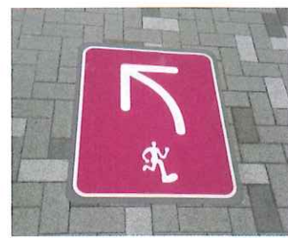
ジョギングコースの順路