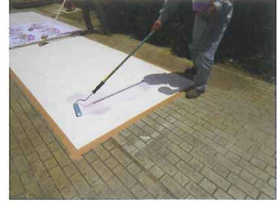
③トップコート1回目 ローラーで均一に塗布