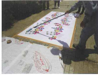
⑤トップコート2回目 ローラーで均一に塗布