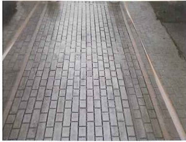
①下地処理 ゴミなどを除去し、プライマーを塗布