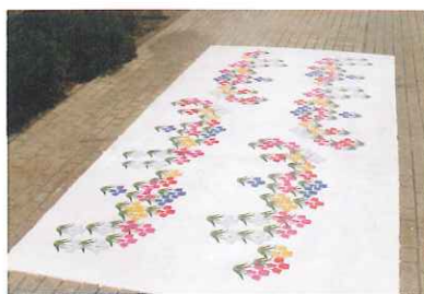
花のデザインの床

国が設置する通信機器と対応システムを搭載した車両で高速、大容量通信。きめ細かな渋滞、事故情報が得られます