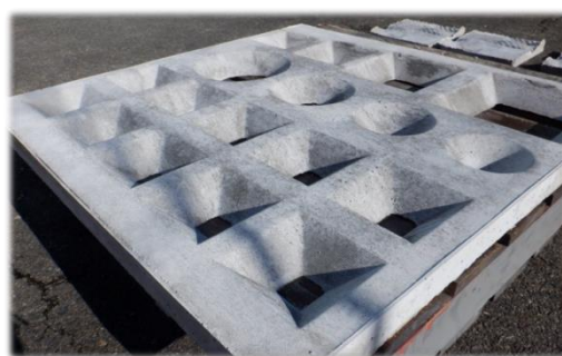
3D プリンティング型枠によるコンクリート製品

三井化学と郡家コンクリート工業は、3D プリンティングと両社の保有技術との協創により、職人スキルの数値化促進やデザインの設計自由度向上を実現し、土木建築製造現場の DX 化への貢献を目指します。