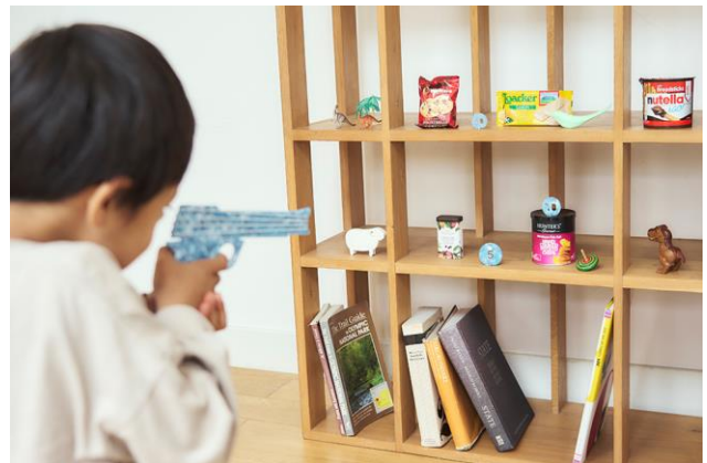
お菓子を的に家でお祭りごっこも