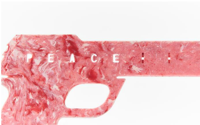
トリガーを引くと PEACE の文字が現れます